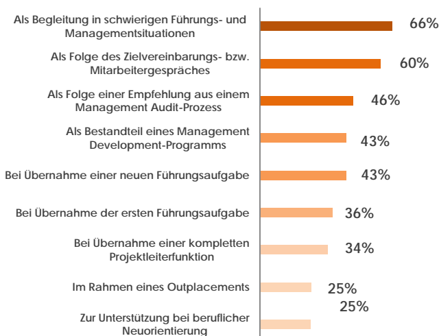
Quelle: Nach einer Studie der Unternehmensberatung Kienbaum mit dem Wirtschaftsmagazin Harvard Business Manager.

Der Coach steuert den Prozess und ermöglicht es dem Klienten, durch gezielte Interventionen seine gewohnten Strukturen zu reflektieren, die eigenen Ergebnisse und Lösungen zu ergründen und seine eigenen Strategien sowie Handlungsoptionen zu finden.